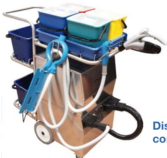
Dispositif de Désinfection Vapeur (DDV) complet